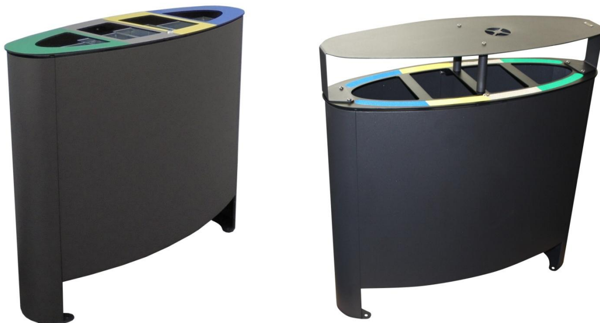
Illustrations non contractuelles

Poubelle de forme elliptique pour le tri sélectif en acier galvanisé et thermolaqué. Visserie en acier inoxydable. La poubelle peut être équipée de trois ou quatre conteneurs intérieurs en acier galvanisé. En option, elle peut être équipée d'un couvercle réhaussé avec cendrier. Le couvercle peut être ouvert par déverrouillage de la serrure (clef fournie). Thermolaquage à choix dans différents coloris RAL, selon nuancier de référence. Inscription, dans la langue souhaitée, du type de déchets. En option, la corbeille peut aussi être réalisée entièrement en acier inoxydable. Fixation au sol par ancrage mécanique.