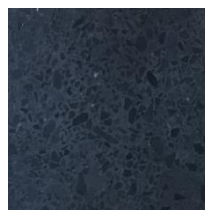
Anthracite poli (plus-value)