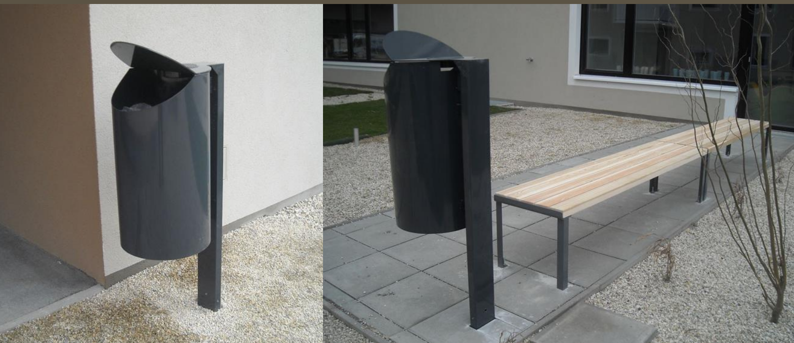
Illustrations non contractuelles

Poubelle composée d'un récipient cylindrique de Ø x 320 x H 495 mm, complété d'un anneau pour tenir le sac. Pour la maintenance, le récipient se déverrouille et bascule pour permettre la vidange. La poubelle est équipée d'un couvercle en tôle.